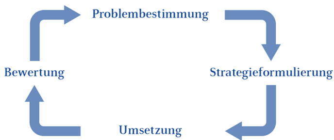
Abbildung: Public Health Action Cycle, in Anlehnung an Hartung/ Rosenbrock 2021 16

Die folgende Abbildung zeigt den Public Health Action Cycle und dient einer besseren Vorstellung des Prozesses. Im Idealfall durchlaufen Sie alle vier Phasen des Prozesses.